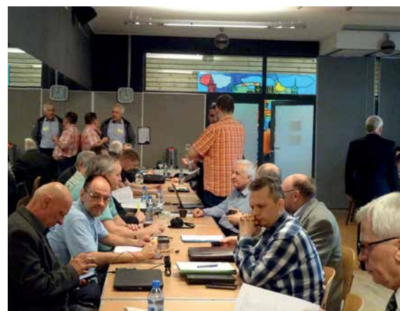
KRÓTKA PRZERWA – ROZMOWY W KULUARACH