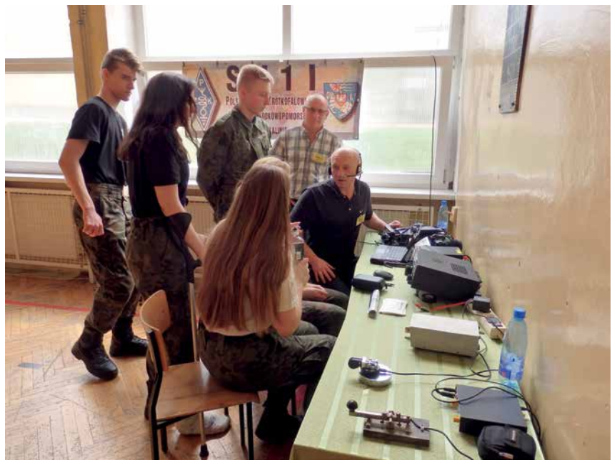
UCZESTNICY POKAZÓW PRACY NA RADIOSTACJI W GIMNAZJUM NR 6 W KOSZALINIE