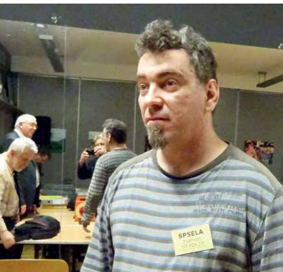
TROCHĘ NA WESOŁO: „ZŁODZIEJ IDENTYFIKATORÓW”. JUŻ PO ZJEŹDZIE „SPIKE” SP9J Z NIESWOIM IDENTYFIKATOREM...

Podobne znaczenie mają odbywające się obecnie już tylko raz w roku Posiedzenia Zarządu Głównego PZK. Po za rzeczywistą działalnością polegającą na podejmowaniu uchwał i wyrażaniu opinii, są one okazją do wzajemnych kontaktów członków organu najwyższej władzy pomiędzy zjazdami. Również podczas Posiedzeń i w przerwach mają miejsce liczne dyskusje i uzgodnienia, które później owocują lepszym współdziałaniem wewnątrz naszego stowarzyszenia, organizacją wspólnych przedsięwzięć etc.