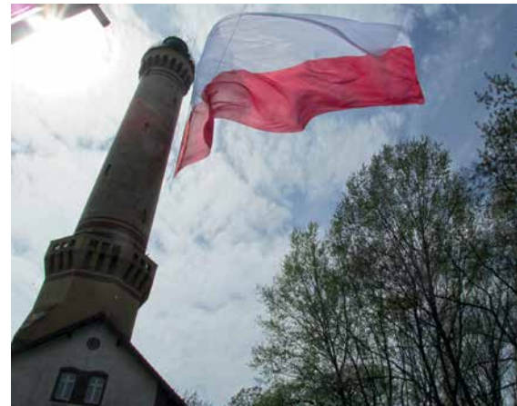
FLAGA RP NA LATARNI MORSKIEJ W ŚWINOUJŚCIU