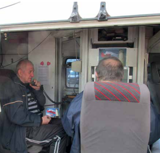
PRACA RADIOSTACJI POD LATARNIĄ W ŚWINOUJŚCIU