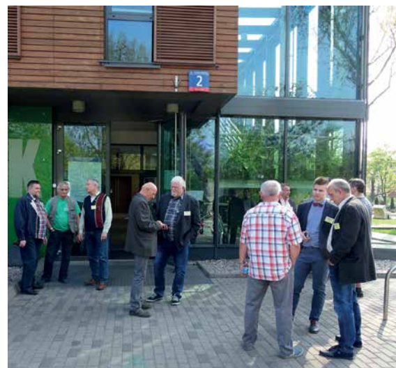
ROZMOWY DELEGATÓW PRZED CPK...

Niezależnie od kwestii prawnych, do rozstrzygnięcia których jest władny wyłącznie Zjazd, to stanowi on okazję do spotkania Kolegów będących najwyższym organem władzy w naszym stowarzyszeniu. Dużo kwestii nie tylko związanych ze Zjazdem, ale i z bieżącą działalnością PZK jest dyskutowanych i często załatwianych w tzw. kuluarach. Tego aspektu władza wykonawcza czyli prezydium nie powinna lekceważyć i tak też działamy.