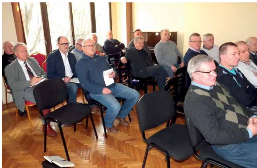
NA SALI OBRAD ZEBRANIA SPRAWOZDAWCZO-WYBORCZEGO W OT 29 PZK