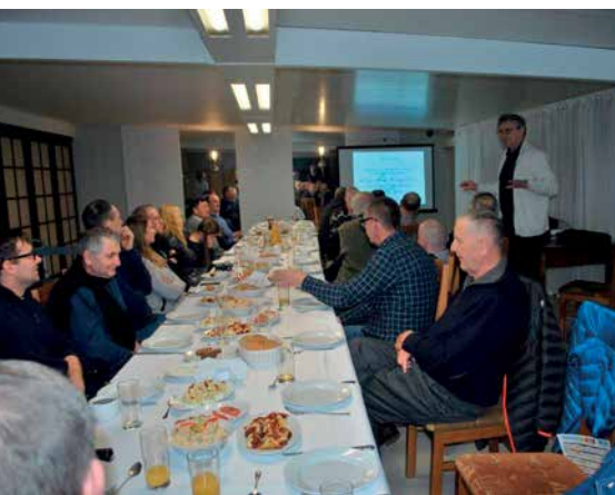
INFORMACJA GRZEGORZA SP3CSD NA TEMAT HISTORII I ROLI OGÓLNO-POLSKIEGO KLUBU SP OTC