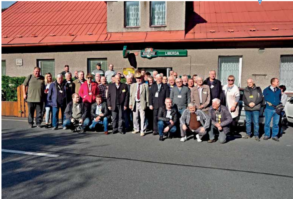
UCZESTNICY SPOTKANIA W TYRZE