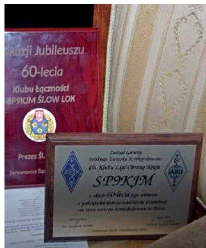
OKOLICZNOŚCIWE GRAWERTONY DLA KLUBU SP9KJM