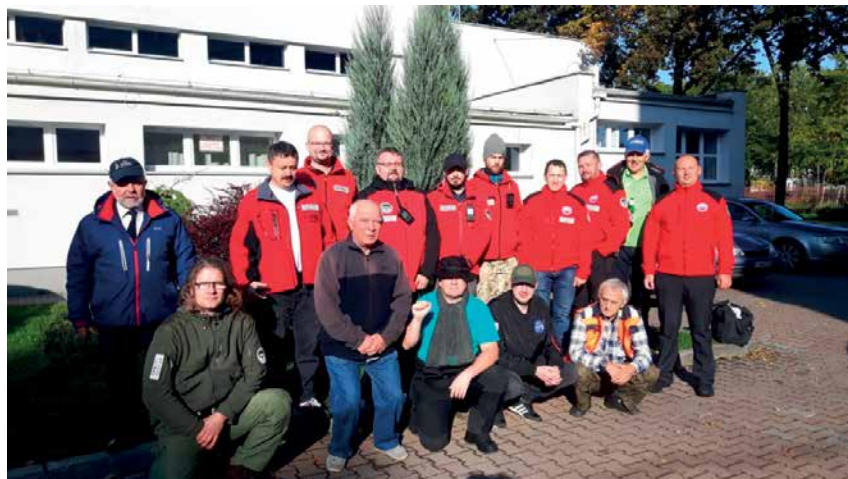
NIEDZIELNY PORANEK. ZDJĘCIE GRUPOWE 15 Z 22 UCZESTNIKÓW ZJAZDU. KOLEDZY, KTÓRYCH NIE MA NA FOTOGRAFII, Z PRZYCZYNY OBIEKTYWNYCH OPUŚCIŁI NAS W SOBOTĘ WIECZOREM LUB WCZEŚNIE RANO W NIEDZIELĘ

Źródło informacji: PAP/as/, lista dyskusyjna VOT PZK (SP3U) Info: SP5ELA