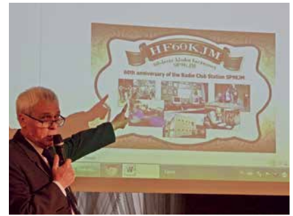
PREZENTACJA OKOLICZNOŚCIOWEJ KARTY QSL

P.S. Informacja na temat sobotniego spotkania, wraz z wieloma zdjęciami, ukazała się na siemianowickim portalu „Reporterskim okiem”: http://www.siemianowice.pl/aktualnosci/uroczystosc-60-lecia-klubu-lacznosci-sp9kjm.15115/ oraz na stronie klubowej SP9KJM http://sp9kjm.pl/index.php/2019/10/22/uroczystosc-60-lecia-klubu-lacznosci-sp9kjm-w-siemianowicach-sl/#more-2016 .